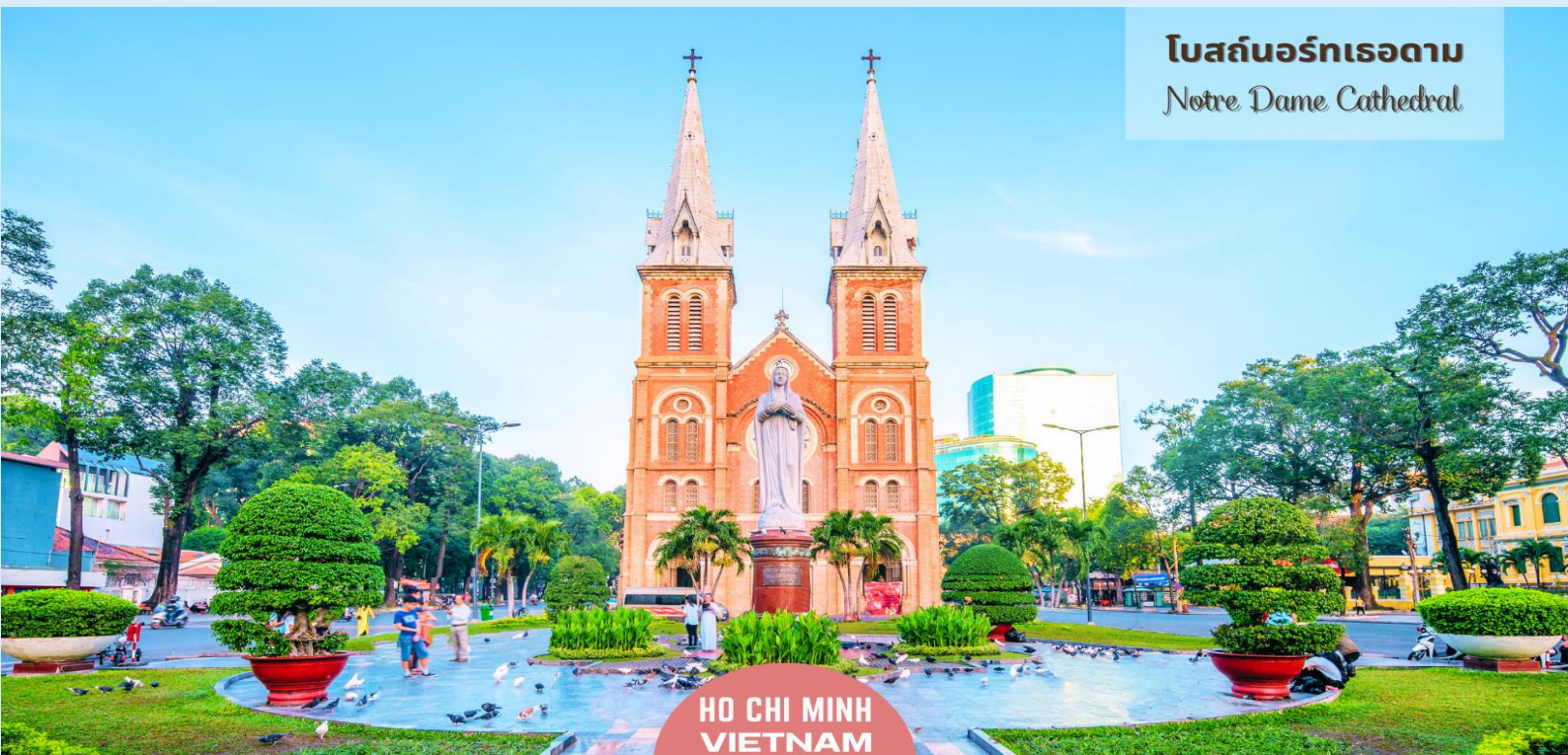
โบสถ์นอร์ทเธอดาม Notre Dame Cathedral

นำท่านถ่ายรูป มหาวิหารนอร์ทเทอร์ดาม เป็นอัญมณีทางสถาปัตยกรรมอันงดงามที่มีความสำคัญทางประวัติศาสตร์และวัฒนธรรม วิหารแห่งนี้สร้างขึ้นในยุคอาณานิคมฝรั่งเศส และเป็นสัญลักษณ์ของมรดกอันมั่งคั่งและความศรัทธาอันยาวนานของชาวเมืองไซงอน วัสดุที่ใช้ก่อสร้างล้วนนำเข้ามาจากฝรั่งเศส เป็นการผสมผสานอิทธิพลระหว่างยุโรปและเวียดนามอย่างลงตัว ความสมบูรณ์ของโครงสร้างเป็นข้อพิสูจน์ถึงคุณภาพของวัสดุเหล่านี้ รวมถึงอิฐสีแดงที่แข็งแรงในส่วนหน้าของอาคารซึ่งมีความวิจิตรสวยงาม และยอดแหลมที่สูงตระหง่าน ภายในวิหารยังได้รับการออกแบบให้รองรับผู้คนได้ประมาณ 1,200 คน