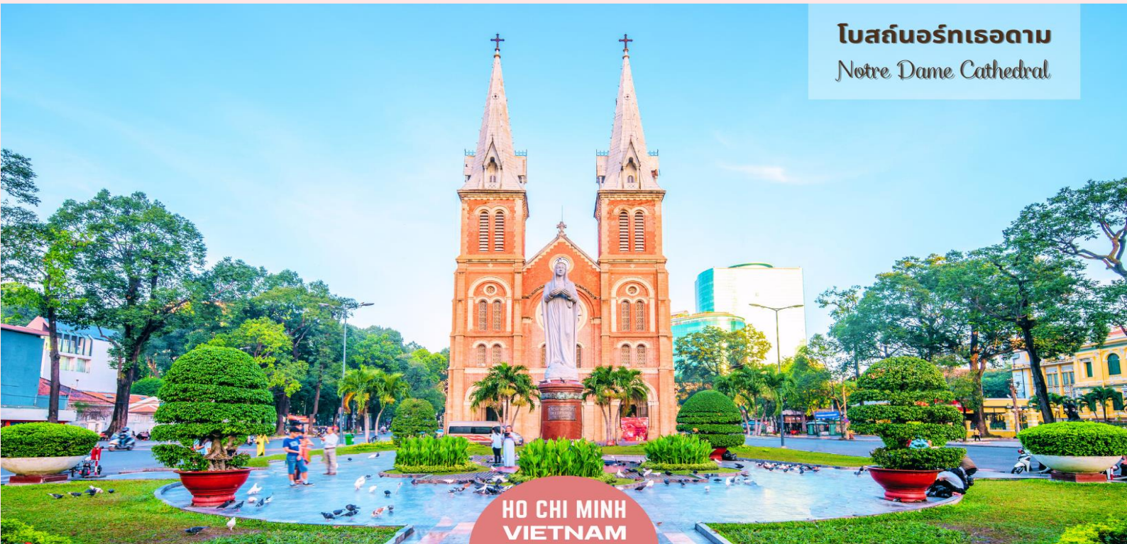
โบสถ์นอร์เทอดาม Notre Dame Cathedral

เลือกซื้อและส่งโปสการ์ดไปยังครอบครัว คนรัก คนรู้จัก หรือส่งให้ตนเองเพื่อเก็บเป็นความทรงจำระหว่างการเดินทาง เป็นจุดหมายปลายทางของนักท่องเที่ยวที่ต้องมาเยือน