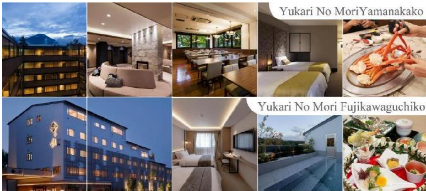
ผิวพรรณสวยงามและช่วยให้ระบบหมุนเวียนโลหิตดีขึ้น

YUKARI NO MORI, YAMANAKAKO หรือระดับเดียวกัน รับประทานอาหารค่ำ ณ ภัตตาคาร ของโรงแรม (4) พิเศษ!! อิ่มอร่อยกับ บุฟเฟ่ต์ขาปู หลังอาหารให้ท่านได้ผ่อนคลายกับการแช่น้ำแร่ธรรมชาติ เชื่อว่าถ้าได้แช่น้ำแร่แล้ว จะทำให้