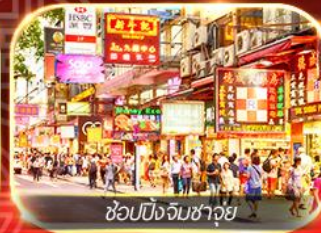
ช้อปปิ้งจิมซาจุ่ย