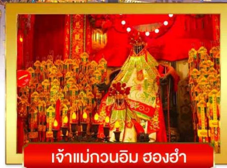
เจ้าแม่กวนอิม สองอำเภอ