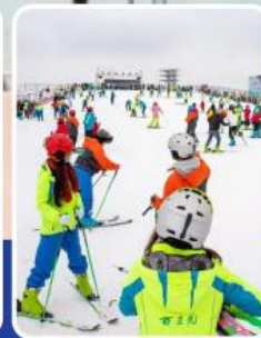
สกีรีสอร์ทไป๋หลี่หวง