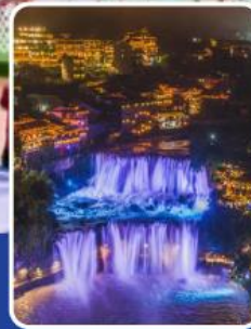
เมืองโบราณฝูหลงเจิ้ง

ล่องเรือชมเขื่อนยักษ์ ที่ลิ่งการใหญ่ที่สุดในโลก