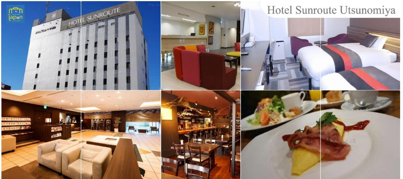
Hotel Sunroute Utsunomiya

พักที่ HOTEL SUNROUTE UTSUNOMIYA หรือระดับเดียวกัน