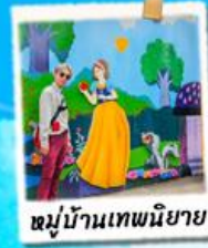
หมู่บ้านเทพนิยาย