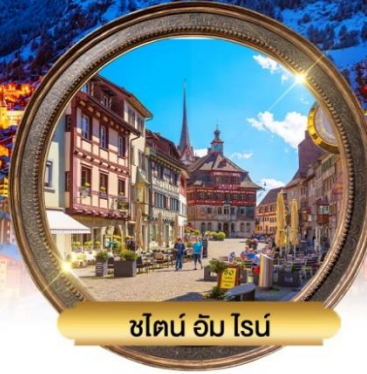
ชไตน์ อัม ไนน์