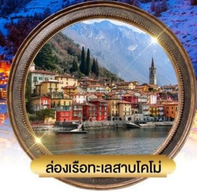
ล่องเรือทะเลสาบโคโม