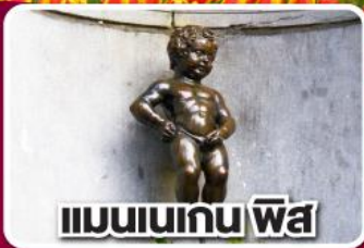
แมนเนเกน พิส