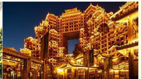
ตึก 72 ชั้น

*ทางบริษัทฯ ขอสงวนสิทธิ์ในการสลับโปรแกรมทัวร์ตามความเหมาะสมขึ้นอยู่กับสถานการณ์หน้างาน โดยคำนึงถึงผลประโยชน์ของลูกค้าเป็นสำคัญ