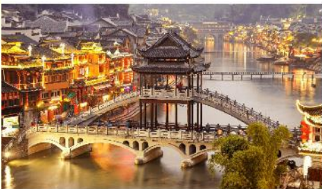
เมืองเฟิ่งหวง