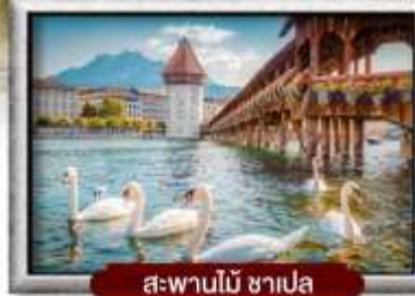
สะพานไม้ ซาเปลา