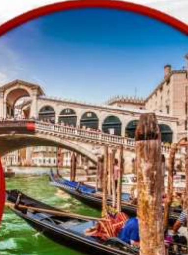
เมืองเวนิส