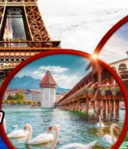
สะพานไม้ ซาเปลา

วีซ่า ฟิลท็อกชั่น ตัวประกันโรงแรม หอพักนำทัวร์