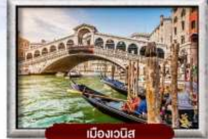
เมืองเวนิส

พิเศษ! หอยเชลล์ + ไวน์แดงฝรั่งเศส | ชีสฟองดูสวิตเซอร์แลนด์ สปาเกี๊ยะดีเส้นหมึกแบบเวนิส