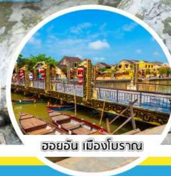
ฮอยอัน เมืองโบราณ