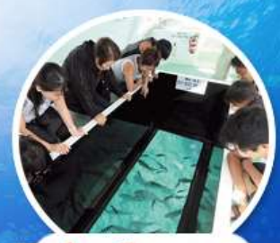
ล่องเรือกระเจก