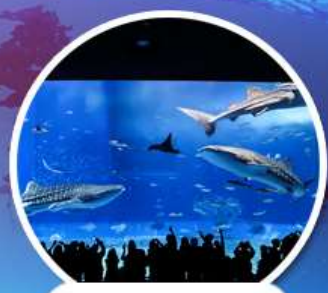
ดูราอุมือควาเรียม