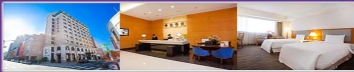
จุดชมวูชุน 89) – ซเหมนตง (สยามสแคว์ไทเป) – แชนาเร

http://www.fushin-hotel.com.tw/taichung/tw/about.php