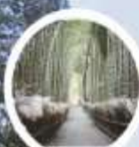
ป่าไฟอารายามา