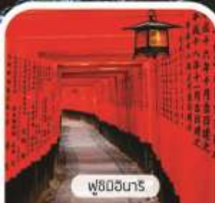
ฟูชิมิอินาริ

โกเบ ฮาเบอร์แลนด์ หมู่บ้านนินจา อังะ เกียวโต ศาลเจ้าจิ้งจอก ฟุชิมิอินาริ ป่าไฟอารายามา สะพานโทเก็ตสึ Expo City ชอปปังจู่ใจ ซินโซบาชิ ริงกุเอ้าเลทและอ็อนมอลล์