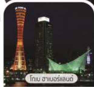
โกเบ ฮาเบอร์แลนด์