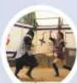
หมู่บ้านนินจา