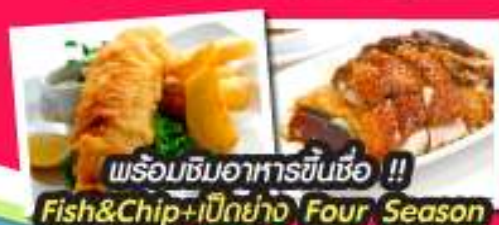
พร้อมชิมอาหารขึ้นชื่อ !! Fish&Chip+เบียร์ย่าง Four Season