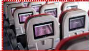
มีจอทุกที่นั่ง