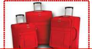
น้ำหนักกระเป๋าสูงสุด 20 กก. ถือขึ้นเครื่อง 7 กก.