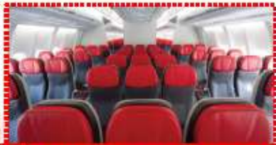
เครื่องลำใหญ่ AIRBUS A330-300 392 ที่นั่ง (3-3-3)

สายการบิน THAI LION AIR ใช้เครื่อง AIRBUS A330-300 จำนวน 392 ที่นั่ง เครื่องใหม่ ลำใหญ่ มีจอทีวี การบริการทุกที่นั่ง จัดที่นั่งแบบ 3-3-3 มีบริการอาหารว่างเสิร์ฟทั้งขาไปและขากลับ (น้ำหนักกระเป๋า 20 กก./ท่าน หากต้องการซื้อน้ำหนักเพิ่ม ต้องเสียค่าใช้จ่าย)