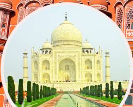
กัชมาฮาล