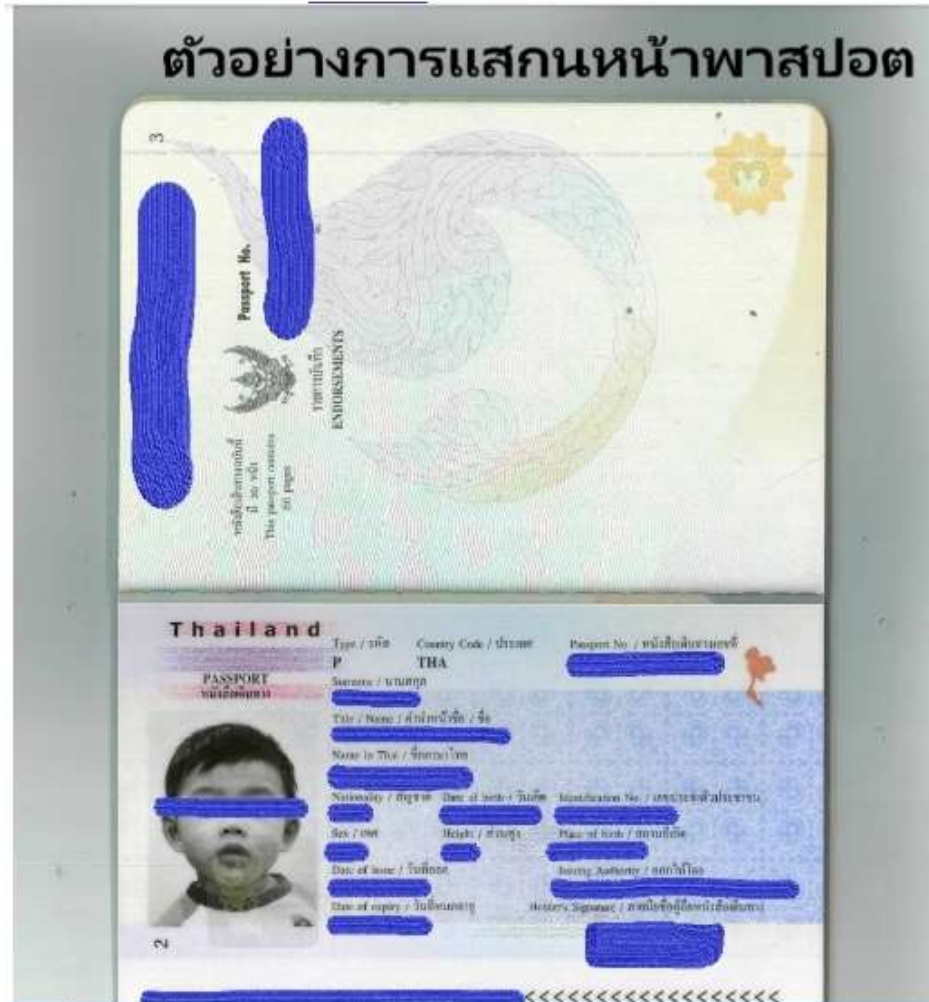
รูปตัวอย่าง ต้องพื้นหลังสีขาวเท่านั้น