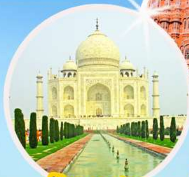
ทัชมาฮาล