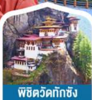
พิชิตวัดทักซัง