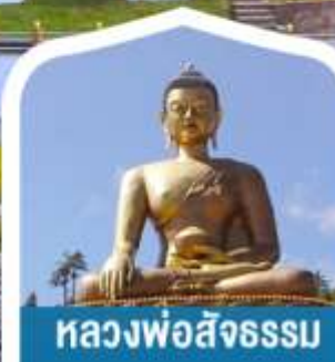
หลวงพ่อสังขรม