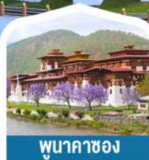
พุนาคาซอง