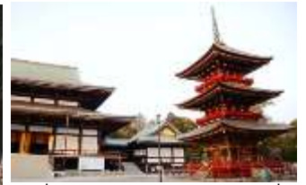
เพื่อเสริมมงคล ให้มีชีวิตที่ดี

ค่ำ ๑๐ รับประทานอาหารค่ำ (มื้อที่2) บุฟเฟต์ซาบูยกษ์ไม่อัน!!!